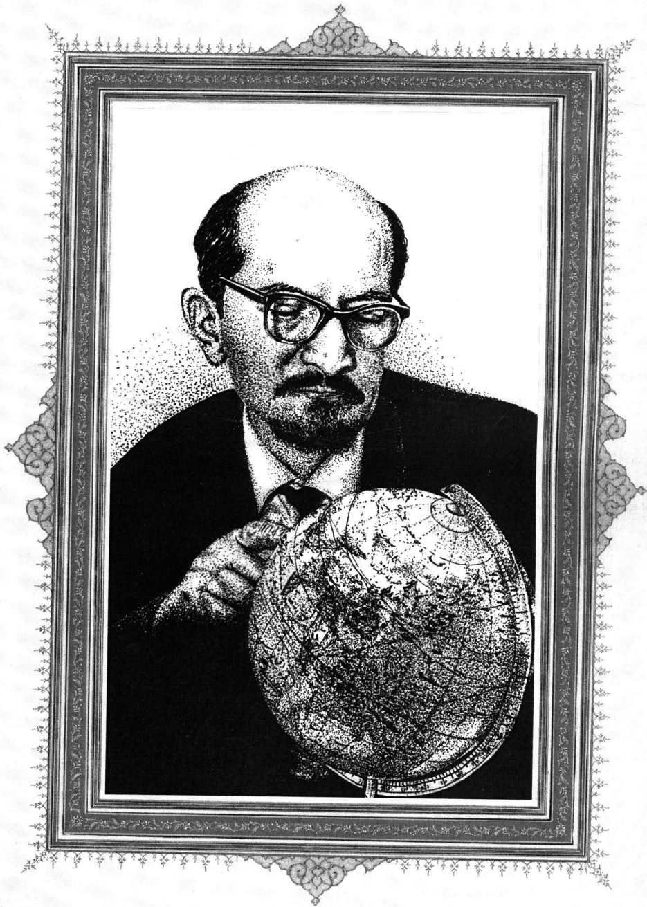
استاد عباس سحاب پدر کارتوگرافی ایران در سن ۴۵ سالگی - نقاشی با قلم فلزی اثر استاد محمد صنعتی