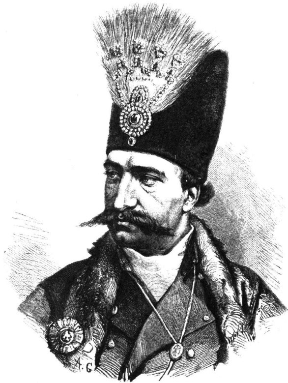
NASSIR-ED-DIN. — SHAH OF PERSIA.